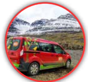
TRANSPORTE EN NORUEGA, Coches de 4 a 9 plazas según el número de viajeros