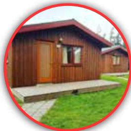
Peak Apartments Laerdal, Noruega