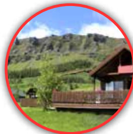
Sande Hotel Lavik, Noruega