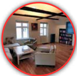
Klosterhagen Hotel Bergen, Noruega